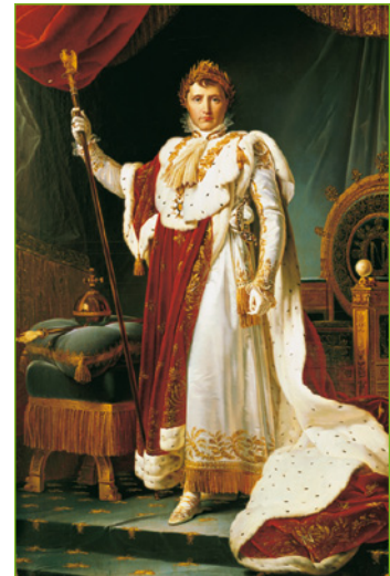
▶ Napoleón en el trono imperial, obra de François Gérard.

Napoleón fue finalmente derrotado en la batalla de Waterloo (1815) por una coalición europea, y desterrado a la isla de Santa Elena donde murió en 1821.