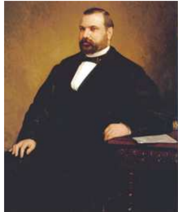
Nicolás María Rivero