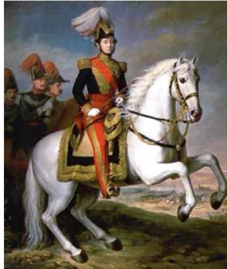
El general Prim.