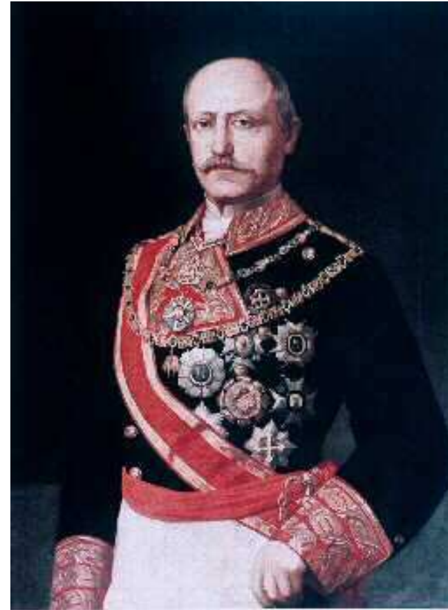
El general Serrano.