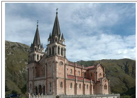
Basílica de Santa María Real en Covadonga. 1877.

Seguramente una vez lo hayas visto, estarás más descansado y tendrás más ganas de enfrentarte a lo que queda (que ya no es mucho).