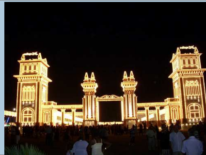
Portada de la feria de Málaga.

No podemos hablar de las costumbres populares y de la cultura popular del siglo XIX sin hablar del flamenco . No está claro cuál es su origen pero sí parece evidente que el momento en que éste comienza a tomar la forma tal y como hoy lo conocemos es durante el siglo XIX. La unión de músicas folklóricas como los verdiales, los fandangos, las seguiriyas o las alegrías de Cádiz, va a ir conformando este arte que, poco a poco van saliendo del ámbito más local para ir llenando los primeros cafés cantantes puramente flamencos allá por la segunda mitad del siglo XIX.