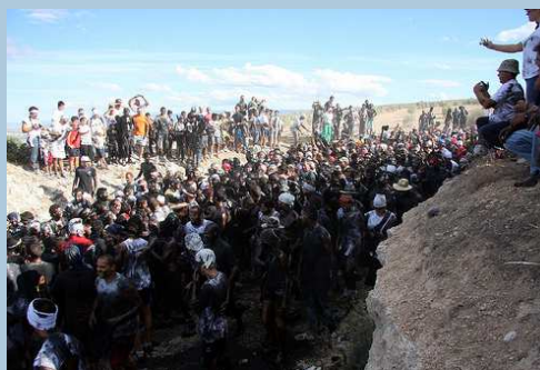
Cascamorras. Baza.