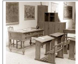
Antigua escuela del puerto de Santa María.

Como ha visto en el vídeo, las tasas de analfabetismo en España eran apabullantes , casi dolorosas: cuando empieza el siglo casi el 90% de la población es analfabeta y cuando termina la situación ha mejorado, aunque no como para sentirse orgullosos: casi el 75%. Es cierto que hubo intentos para paliar esta situación , pero las medidas impuestas por los gobiernos, como la ley Moyano de 1857. nunca fueron lo suficientemente ambiciosas como para solucionar de forma definitiva esta situación. En cualquier caso no podemos culpar solo a las administraciones de este fracaso, has de saber que durante el siglo XIX la escuela y la educación no eran ni mucho menos sinónimos de éxito, Que un niño fuera a la escuela suponía que hubieras menos manos trabajando y los sueldos no estaban como para renunciar a estas manos.