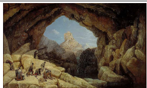
Cueva del gato , típico lugar de refugio de los bandoleros.