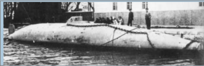
Submarino de Isaac Peral. 188.

por razones desconocidas, la propia marina no solo rechazó el invento sino que además se encargó de desprestigiar , deshonorar y hasta humillar al murciano que no tuvo más remedio que dejar la armada.