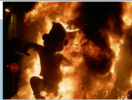
Las Fallas de Valencia. Imagen de stvcr en flickr bajo licencia C.C