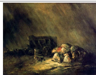
Lucas Velázquez. La diligencia bajo la tormenta. 1856 Archivo de Wikimedia Commons abjo licencia C.C

Pero quizá uno de los ejemplos más claros del nivel de atraso de nuestro país sea el relacionado con las comunicaciones . Éstas apenas habían variado lo más mínimo en los últimos siglos. Las vías de comunicación seguían, a grades rasgos, las líneas de las vías romanas (vía de la plata, por ejemplo) y, mientras en Europa en ferrocarril comenzaba su despegue, en España los medios de transporte más utilizados eran la diligencia para las carreteras principales y las galeras para las secundarias. Las únicas mejoras que se producen al respecto son las que adecentan las condiciones de estos carruajes. No será hasta bien entrada la segunda mitad del siglo XIX cuando el ferrocarril llegue a España, pero eso lo veremos más concretamente en el siguiente tema.