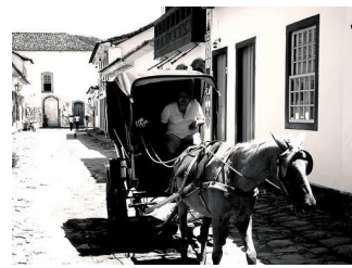
Carruaje en Brasil.