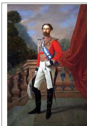
XV Duque de Medinaceli, el mayor latifundista de su época.