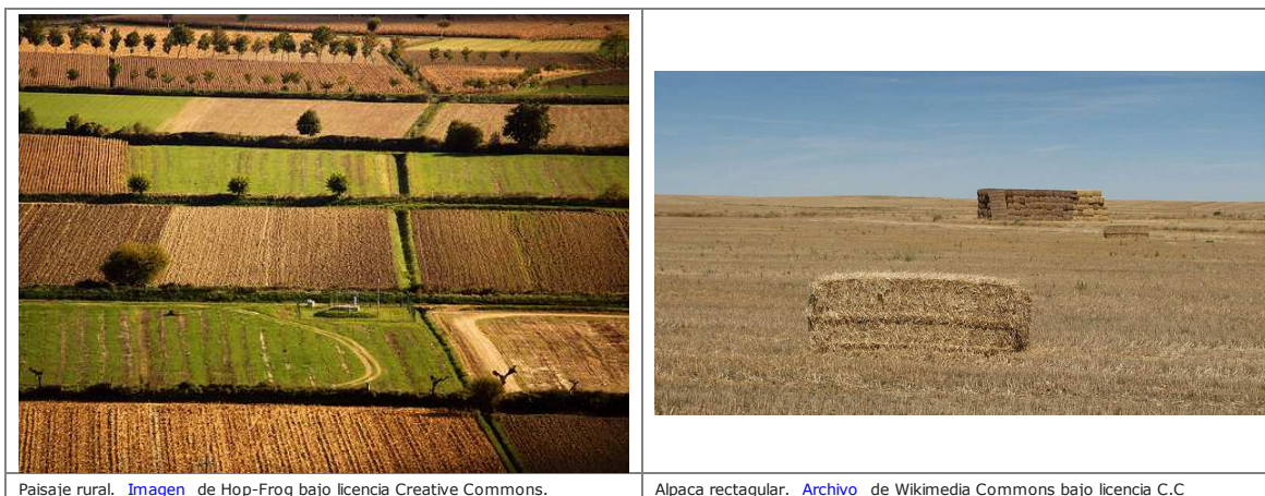
Paisaje rural.