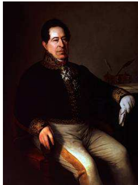
Juan Álvarez de Mendizábal.

Te dejamos esta brevísima introducción general sobre las desamortizaciones para que vayas entrando en materia.