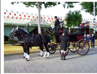
Carruaje en la feria de Sevilla.