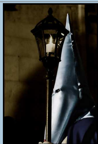
Iluminando el camino. Imagen de Crisologo en Flickr bajo licencia C.C

Por supuesto una de las celebraciones de más peso durante el siglo XIX (y el XX, al menos en nuestra comunidad) será la Semana Santa, para la que la llegada del romanticismo supuso un empujón fundamental, llevando a los cortejos procesionales a algo muy parecido a lo que conocemos hoy día.