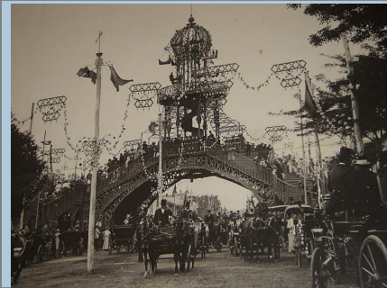
Antigua portada de la feria de Sevilla. Archivo de Wikimedia Commons bajo licencia Creative Commons.

Otras fiestas tienen otro tipo de carácter, como el conmemorativo: la feria de Málaga, que se enmarca para celebrar el IV aniversario de la entrada de los Reyes Católicos en Málaga allá por el año 1487, o puramente comercial, como la feria de Sevilla, que surge como una feria del ganado (y que, por si no lo sabías, fue fundada por un vasco y por un catalán) en el año 1846.