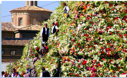
Fiestas del Pilar de Zaragoza.