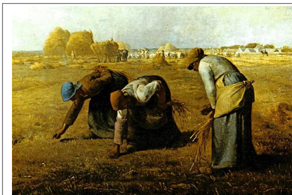
Las espigadoras, de Jean Françoise Millet.