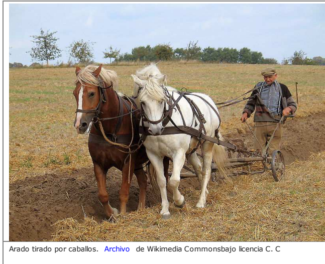
Arado tirado por caballos.

Como decíamos en la introducción la economía española del siglo XIX, sobre todo en su primera mitad es básicamente agraria . A comienzos del siglo XIX el 56% de la producción nacional (el 82% si incluimos la ganadería) proviene del campo. Esto ya supone una diferencia importante con respecto a países con un desarrollo económico (y político) importante como Francia, Prusia (la futura Alemania) y, como no, Inglaterra que lleva prácticamente un siglo de ventaja en materia económica al resto del mundo.